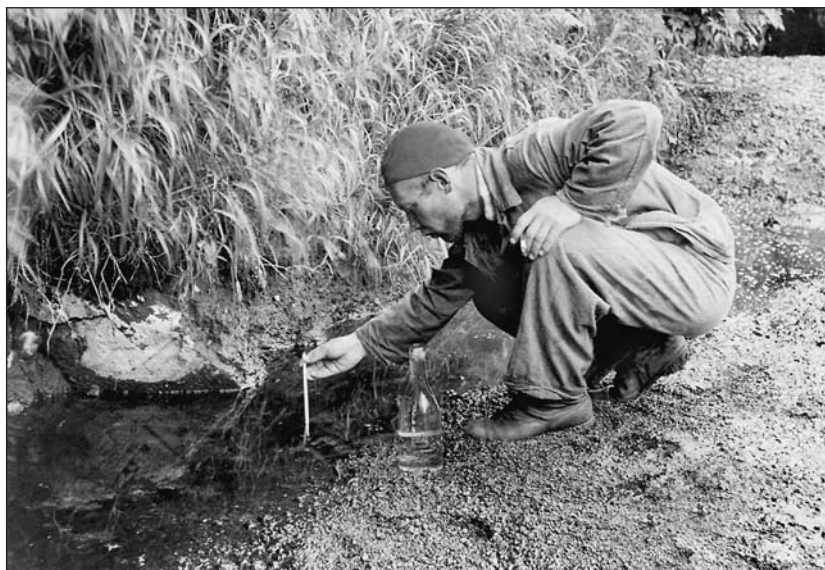
Работа на термальных площадях. Конец 30-х — начало 40-х годов.