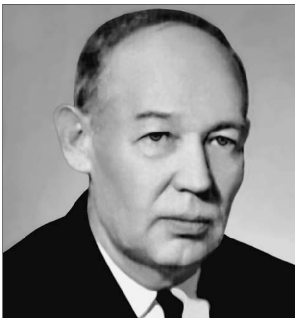
Борис Иванович Пийп (1906—1966).

Борис Иванович Пийп — член-корреспондент АН СССР, геолог и вулканолог с мировой известностью, организатор и первый директор Института вулканологии АН СССР на Камчатке. Имя ученого присвоено бульвару, на котором находится институт.