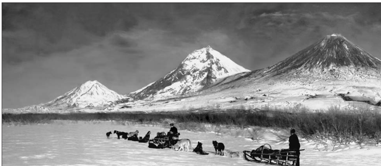
Полевые работы в зимнее время на вулканах Ключевской группы (слева направо: Безымянный, Камень, Ключевской).