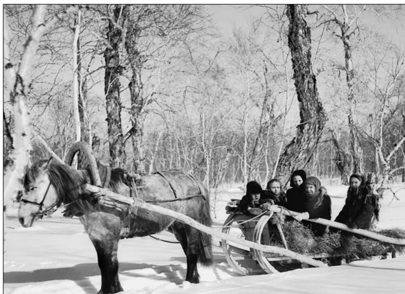
Зимние развлечения детей вулканостанции.

Обратно в Москву мы вернулись в октябре 1954 г. Летели на самолете примерно неделю с посадками и ночевками в Петропавловске-Камчатском, Магадане, Хабаровске, Иркутске и Свердловске.