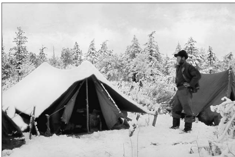
Типичный камчатский ландшафт в конце октября. 1950 г.

ходила также большая подзорная труба для наблюдений за Ключевской группой вулканов и химическая лаборатория. На территории станции помещались конюшня для семи лошадей, баня, склад. Всегда держали две упряжки собак, которые зимой и летом находились на улице на привязи. На реке стояло несколько рыбалок — небольших построек, где рабочие ловили и коптили рыбу для сотрудников и собак.