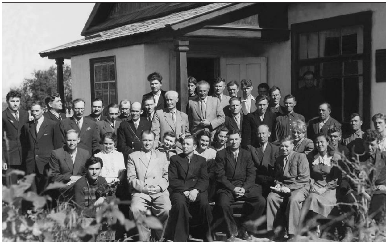
Участники Вулканологического совещания на вулканостанции в Ключах. 1955 г.