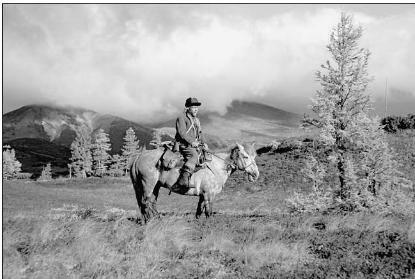
В полной готовности к выезду в маршрут. 1950-е годы.