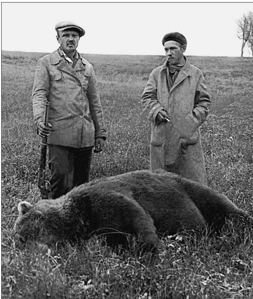
Основной продукт питания — медведи.

да стоял голод, и многие люди, спасаясь от него, ехали на Камчатку работать. Вербованные размещались в трюме и на палубе. Единственную очень маленькую каюту на пароходе занимала наша семья. Пароход остановился на рейде Усть-Камчатска, и людей в большой «корзине» спускали на плоскую, без каких-либо перил баржу и везли на берег. На поверхности моря плавали небольшие круглые снежно-ледяные лепешки, которые назывались «сало». Из Усть-Камчатска в Ключи ехали два дня по замерзшей реке на двух собачьих упряжках. Это было в апреле, а река была подо льдом. Помню, как шутили местные каюры: «Усть-Камчатск — это Ленинград, а Ключи — Москва». В Ключах мы с сестрой сразу пошли в школу, где проучились 4,5 года.