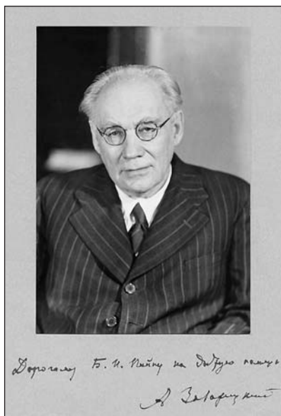
Фотография А.Н.Заварицкого с дарственной надписью. Конец 40-х годов.

гическую работу, но в 1936 г. в связи с экспедициями на Камчатку, требовавшими длительного отсутствия, вынужден ее прекратить.