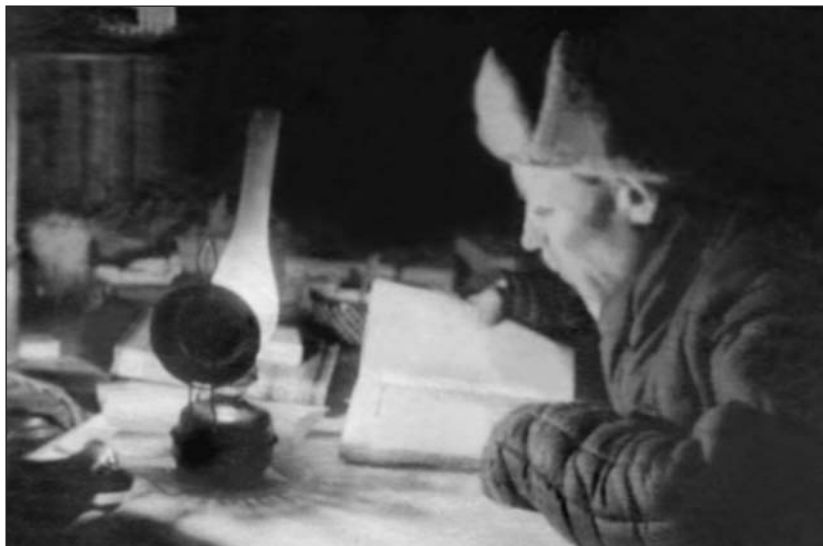
На Камчатской вулканостанции во время войны.