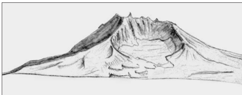
Схематическая зарисовка вулкана Большой Семячик.

Здесь и далее зарисовки из дневников Б.И.Пийпа