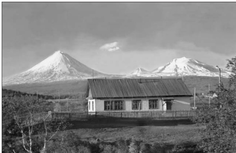
Здание лаборатории на фоне Ключевской группы вулканов.