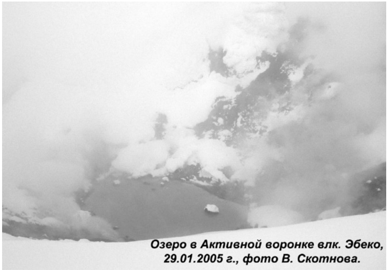
Озеро в Активной воронке влк. Эбеко, 29.01.2005 г.

бирюзового цвета размером 7x12 м (рис. 4). На внешних склонах Активной воронки были обнаружены 3 пепловых слоя мощностью 1-2 мм, пепел протягивался на расстояние до 500 м от воронки. Также наблюдалась мощная фумарольная деятельность вулкана, парагазовый столб поднимался до 300 м над кратером. 30 января интенсивность парагазовой деятельности вулкана, по визуальным оценкам, увеличилась, озеро исчезло.