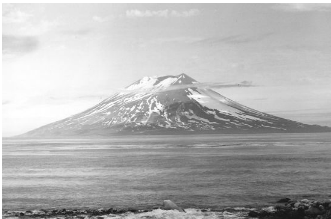
Рис. 1. Вулкан Алаид.

На островах, относящихся к группе Северных Курил, находятся 6 действующих вулканов: Алаид на о. Атласова (рис. 1) и вулканы Эбеко, Чикурачки, Татаринова, Карпинского и Пик Фусса на о.Парамушир. Ниже будет приведена краткая характеристика деятельности каждого из этих вулканов и степень их опасности для авиации.