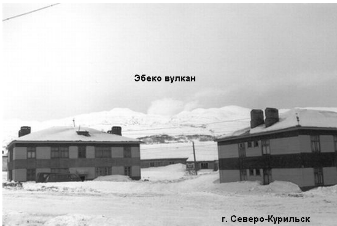
Рис. 3. Вулкан Эбеко.

изверженного материала Эбеко занимает одно из последних мест [9]. Преобладающим в 17-20 веках был фреатический тип извержений вулкана, извержение его в 1934-35 гг. названо условно фреато-магматическим [9]. Исторически зафиксированные извержения и активизации вулкана происходили, по данным из работ [9,10,12], в 1793, 1833-1834(?), 1859, 1934-1935, 1963, 1967, 1969, 1987-91, 1998, 2005.