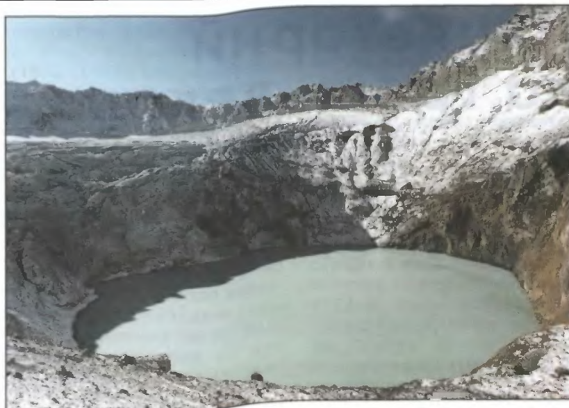
Термальное озеро, образовавшееся летом на месте растаявшего ледника.

Летние исследования в кратере Мутновского показали, что после мартовского извержения в воронке взрыва, которая до того была занята ледником, опять сформировалось термальное кислое озеро, аналогичное существовавшему здесь ранее. Вероятно, через это вновь образованное озеро происходит достаточная масс-энергетическая разгрузка вулкана, предотвращающая повторные крупные взрывы. Об этом свидетельствует и величина тепловой мощности кратера, в котором произошло