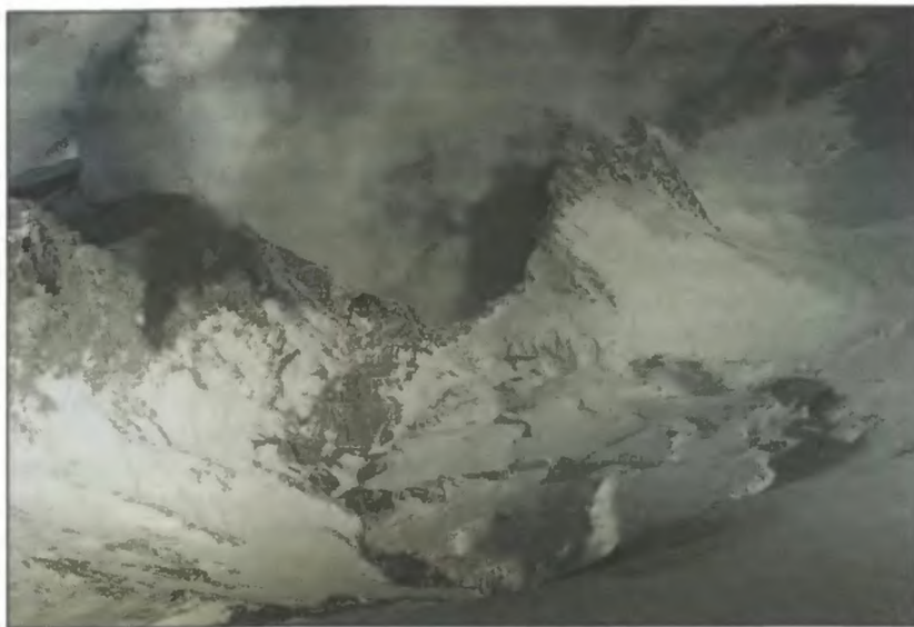
Активная Воронка — один из действующих кратеров вулкана Мутновский. На переднем плане — воронка мартовского извержения 2000 г., занятая ледником, деформированным взрывом.

свидетельствовали о фреатическом характере взрыва (т.е. выбросе пара и старых вулканических пород).