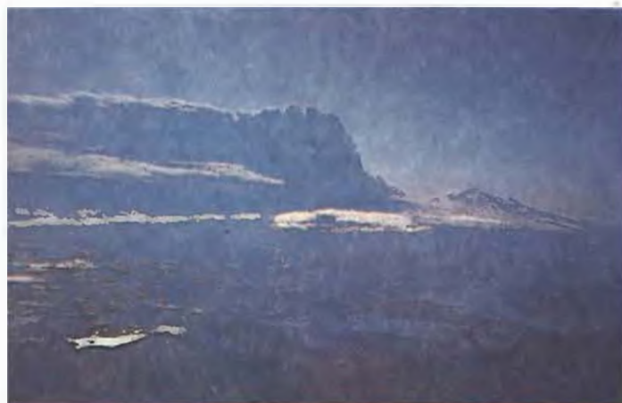
1 октября, 20 час. 15 мин.; шлейф от извержения Ключевского вулкана.

взрывы. В свою очередь они приводили к образованию огромных черных густых облаков типа цветной капусты, поднимающихся на высоту до 7 км, а также формировали мощные грязевые потоки.