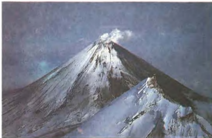
Ключевский вулкан после окончания извержения. На переднем плане вулкан Камень.

38—40 м/с, направление ветра было восточным. Нижняя граница тропопавзы находилась на высоте 10 км, инверсия температуры в атмосфере начиналась на высоте 10.5 км.