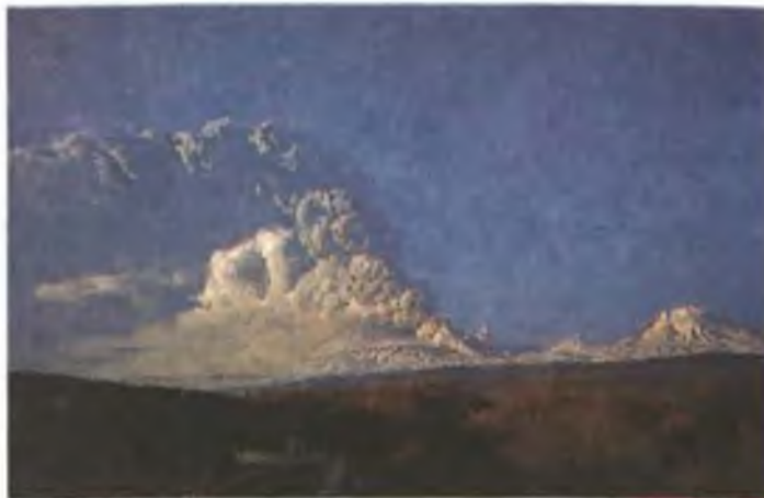
Активность Ключевского вулкана 1 октября 1994 г., 9 час. 30 мин. К этому времени высота эруптивной колонны достигла 12.5 км над ур. м. В нижней правой части фотографии видны фреатические взрывы в Крестовском желобе. Вид со стороны г. Ключи.