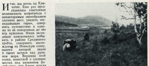
Часть маршрута экспедиции проделала на лошадей.

По справочникам, Ичинская сопка считается в списке потухших, недействующих вулканов. Последнее ее извержение было много веков назад. Однако охотники и оленеводы, козгующие по близости, утверждают, что и сейчас сопка иногда «пирит». Мы поставили себе целью уточнить эти противоречивые сведения — подняться на вершину Альпы, описать маршрут, произвести предварительные исследования в зоне кратера. Нам предстояло перелезть через Средний хребет и спуститься в бассейн реки Быстрой. В оба конца маршрут путешествия составил почти 200 километров.