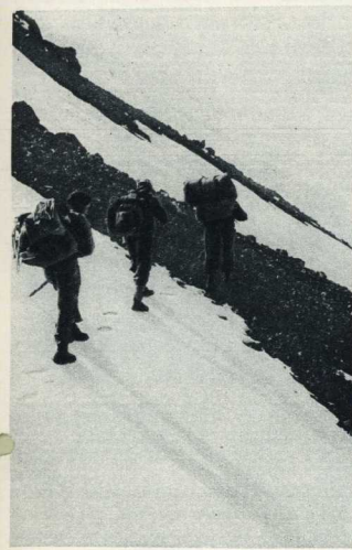
По краям ледника — откосы каменных осепей.

Ранним солнечным утром отряд покинул базовый лагерь. Прорубившись сквозь цепкие заросли кедрового стланника, мы поднялись к давовому потоку — хаотическому нагромождению обломков и плит самой различной формы. Разрушенное временем каменное плато тянулось в сторону вершины.