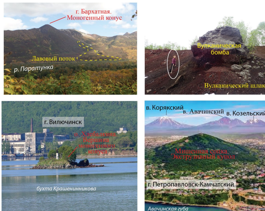
Рис. 1. Фото моногенных конусов и экструзивного купола МПЗ.

v_{8/4} = 0.20 \% . Эти вариации (прежде всего, по ^{207}\text{Pb}/^{204}\text{Pb} ) не могут быть объяснены разновозрастностью изученных магматических образований. Таким образом, они отражают первичную неоднородность магматических расплавов по изотопному составу Pb, что может свидетельствовать как о гетерогенности мантийного источника, так и о процессах контаминации мантийных расплавов на коровом уровне.