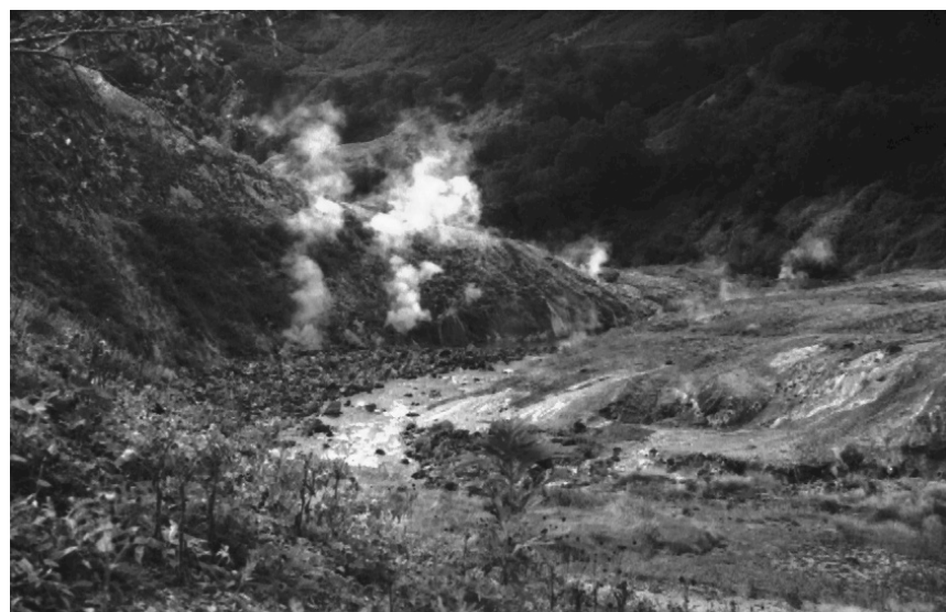
Рис.2. Строение участка русла реки Гейзерной перед створом 1 (гейзер Горизонтальный в центре кадра виден по обильному пароотделению после извержения) летом 1961 г.